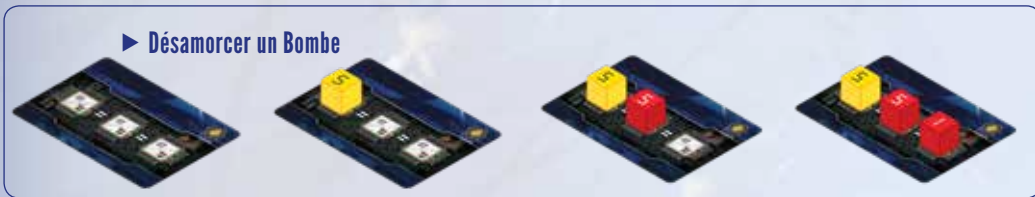
► Désamorcer un Bombe