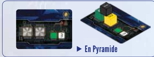
► En Pyramide