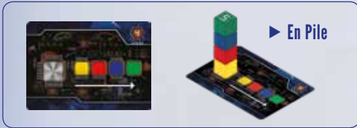
► En Pile